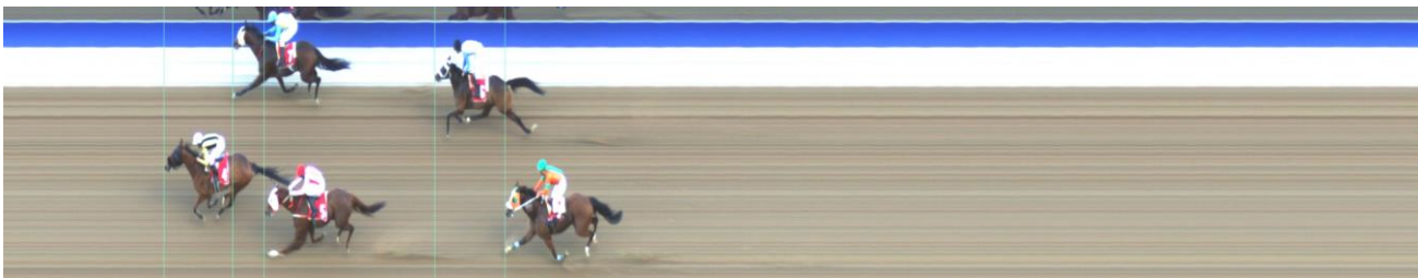
ΜΑΪΚΡΟΝΑΪΖ (IRE) | Dream Ahead (USA) - Marmaria (SPA) | ΝΙΚΗΣ: 2 ΙΔΙΟΚΤΗΤΗΣ: AEGEAN STABLES | ΠΡΟΠΟΝΗΤΗΣ: Κουβαράς Χρ.

-Για διαδικαστικούς λόγους λήφθηκαν ούρα από τον ίππο ΠΟΛΙΟΡΚΗΤΗΣ.