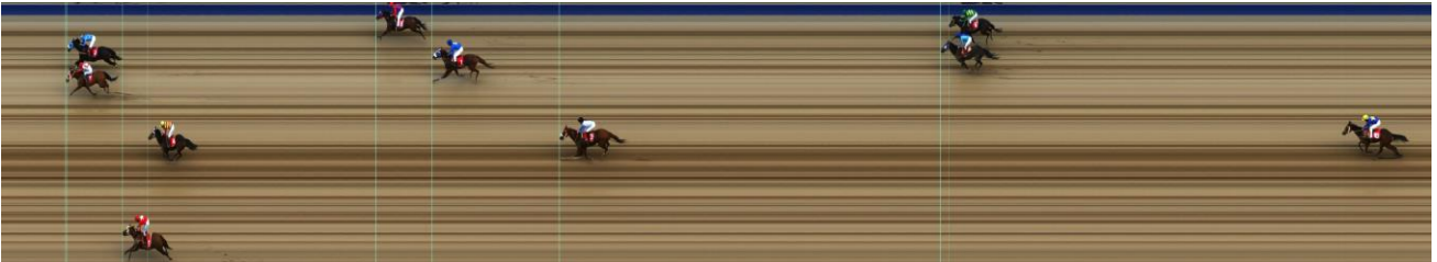
ΚΡΙΕΤΙΒ ΤΖΙΝΙΟΥΣ (GB) | Acclamation (GB) - Divine Power (GB) | ΝΙΚΗΣ: 4 ΙΔΙΟΚΤΗΤΗΣ: ΘΕΟΛΟΓΟΥ ΠΑΝΑΓΙΩΤΗΣ | ΠΡΟΠΟΝΗΤΗΣ: Θεολόγου Π.

-Ο ίππος ΓΟΥΙΝΝΕΡ ΜΩΥΣΗΣ παραπέμφθηκε προς κτηνιατρική εξέταση όπου διαπιστώθηκε σπασμένο δόντι και μετά από ενδοσκοπήση διαπιστώθηκαν βλέννες στην τραχεία. Κτηνίατρο: Αρβανίτης, Αντωνίου.