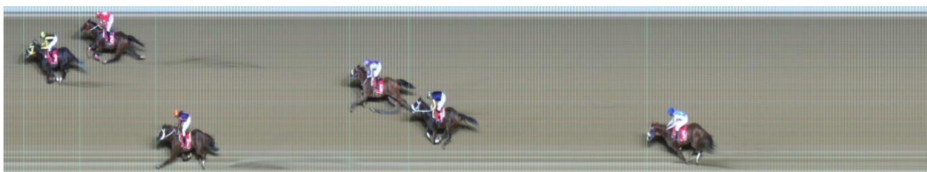
ΜΠΑΡΑΣΤΙ ΝΤΑΝΣΕΡ (IRE) | Helmet (AUS) - My Girl Lisa (USA) | ΝΙΚΕΣ: 4 ΙΔΙΟΚΤΗΤΗΣ: ΑΕΓΕΑΝ STABLES | ΠΡΟΠΟΝΗΤΗΣ: Θεοδωράκης Χρ.

- Μεταζυγίσθηκαν όλοι οι αναβάτες των σημερινών υποδρομών.