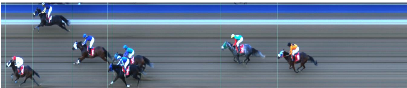
ΓΚΡΕΪΤ ΜΠΙΛΙΒ (GR) | Tiantai (USA) - Βικτώρια Γουέι (GB) | ΝΙΚΗΣ: 1 ΙΔΙΟΚΤΗΤΗΣ: ΚΟΥΪΝΣΓΟΥΪ ΑΕ | ΠΡΟΠΟΝΗΤΗΣ: Κεράτσα Ειρ. | ΙΠΠΟΠ/ΓΟΣ: ΚΟΥΪΝΣΓΟΥΪ ΑΕ

-Ο ίππος ΜΠΑΡΑΚΑ ΡΟΚΣ επέστρεψε με τραυματισμό προσθίου αριστερού άκρου. Κτηνίατροι: Αντωνίου, Κολάνης.